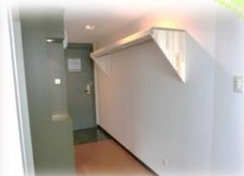
枕棚付きのW I C