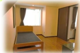
南向きの明るく、ゆったりの室内