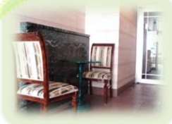
エントランス/EVホール 絵画を飾って癒しの空間