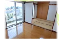
上階 洋室7帖/和室6帖