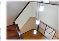
開放的な吹き抜け