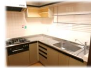
収納たっぷりのセミオープンシステムキッチン