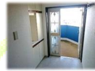
戸建て感覚の玄関