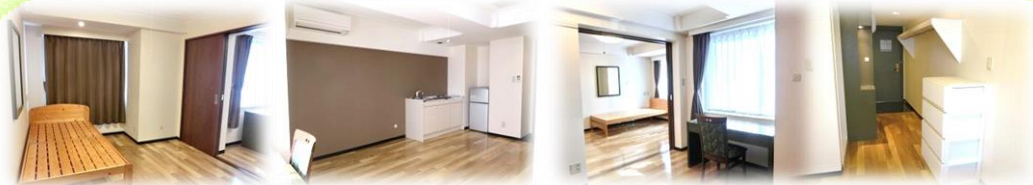
南向きの明るく、ゆったりの室内