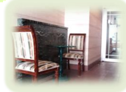
エントランス/EVホール 絵画を飾って癒しの空間