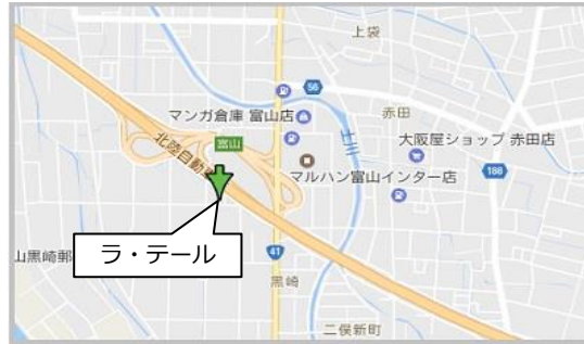
富山インターすぐ近く