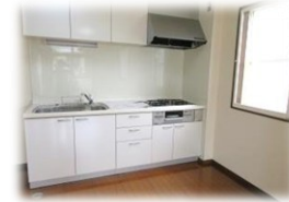
▲収納たっぷり システムキッチン