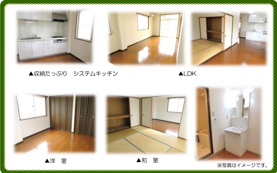
▲収納たっぷり システムキッチン