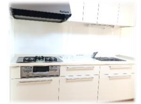
▲システムキッチン