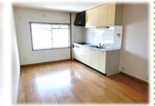
▲収納たっぷり システムキッチン