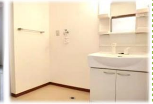
▲シャブードレ-ッサー ※写真はイメージです。