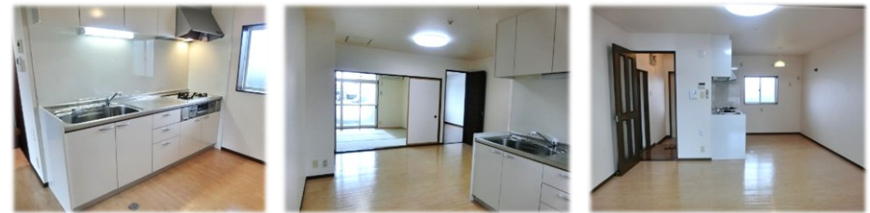
▲収納たっぷり システムキッチン ▲LDK~和室 ▲LDK