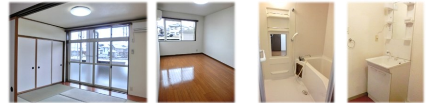
▲和室 ▲洋室 ▲浴室・シャワードレッサー