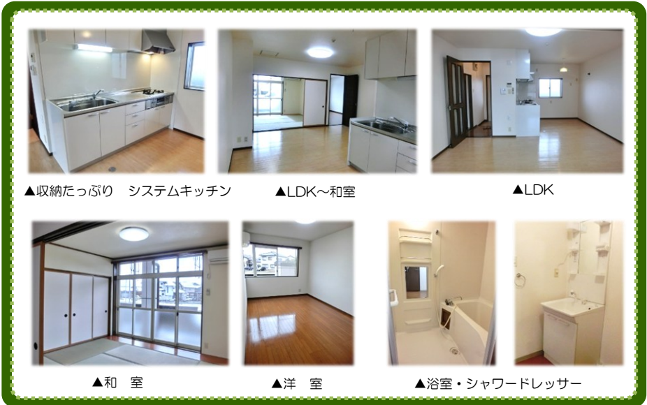
▲収納たっぷり システムキッチン ▲LDK~和室 ▲LDK